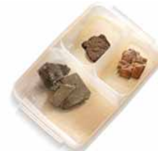
Krupp HM 960